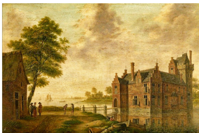
Schilderij Hombeek Carmosteyn van Hendrik Frans De Cort uit de collectie van het Kon. Museum Schone Kunsten van Antwerpen

De waterput is het enige dat van de hoeve nog rest.